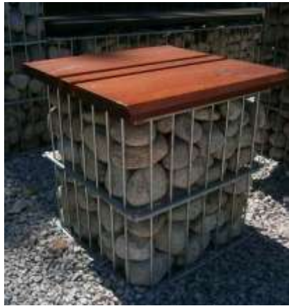
Taboret z siedziskiem Wysokość x długość x szerokość 40 x 40 x 40 cm