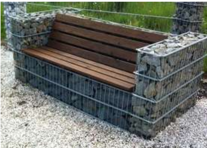
Kanapa z siedziskiem Wysokość x długość x szerokość 80 x 200 x 100 cm