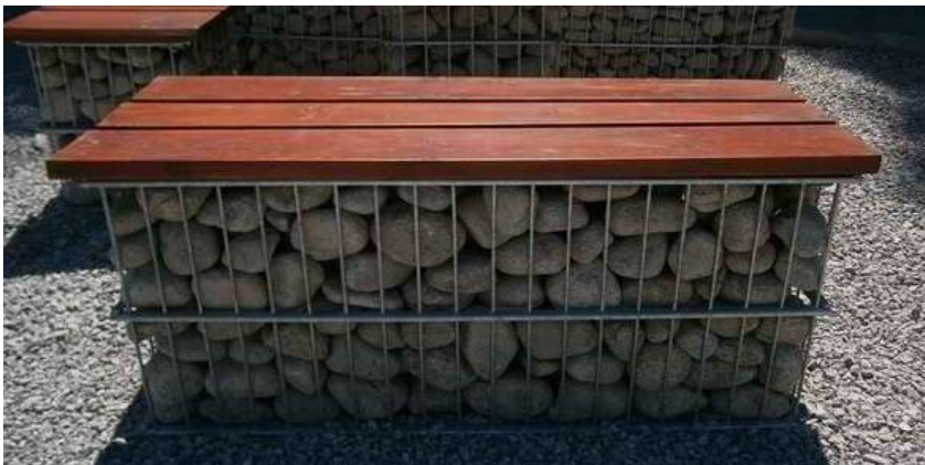
Ławka z siedziskiem Wysokość x długość x szerokość 40 x 100 x 40 cm